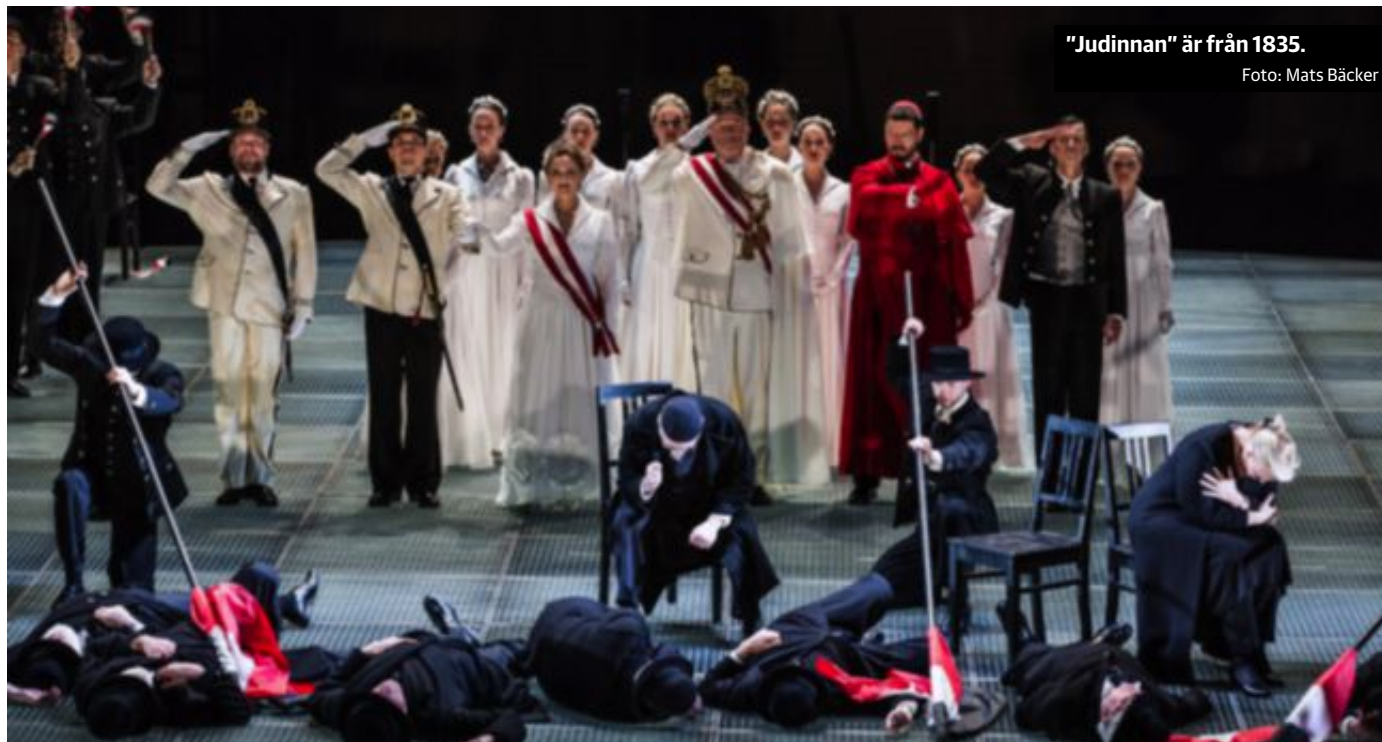
"Judinnan" är från 1835.