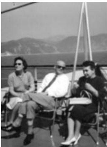
Kryssning i Jugoslavien 1963.